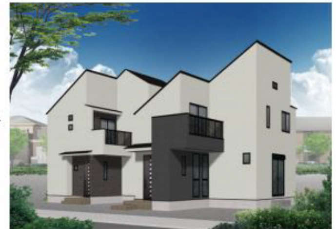
※パース・外構イメージは図面をもとに描き起こしたもので実際とは多少異なります。