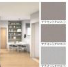
2号棟 内装イメージ(カーム)