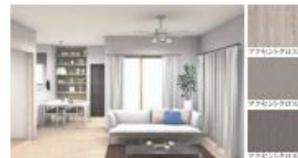
3号棟 内装イメージ(スマート)