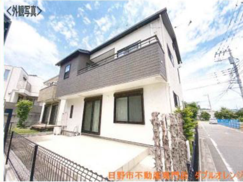
日野市不動産専門店 ダブルオレンジ