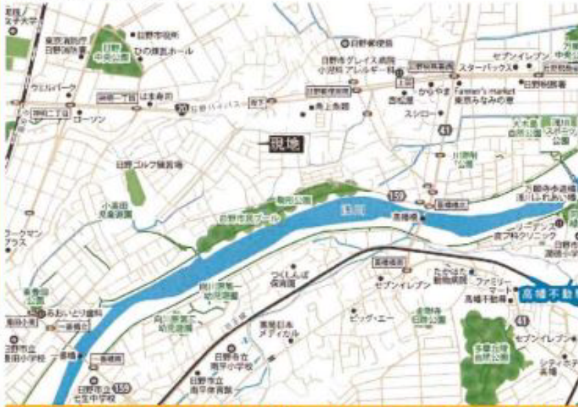
カーナビは、「日野市川辺堀之内85-13」とご入力ください